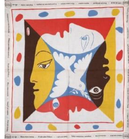
Pablo Picasso- Festival mondiale dei giovani per la Pace – Berlino 1951

Tra le religioni è possibile un cammino di pace. Il punto di partenza dev'essere lo sguardo di Dio. Perché Dio non guarda con gli occhi, Dio guarda con il cuore. E l'amore di Dio è lo stesso per ogni persona, di qualunque religione sia. E se è ateo, è lo stesso amore. Quando arriverà l'ultimo giorno e ci sarà sulla terra la luce sufficiente per poter vedere le cose come sono, avremo parecchie sorprese! (FT 281)